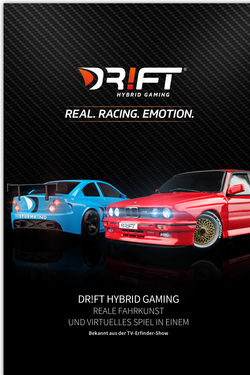
Example: Fair folder

These must be checked in each individual case.